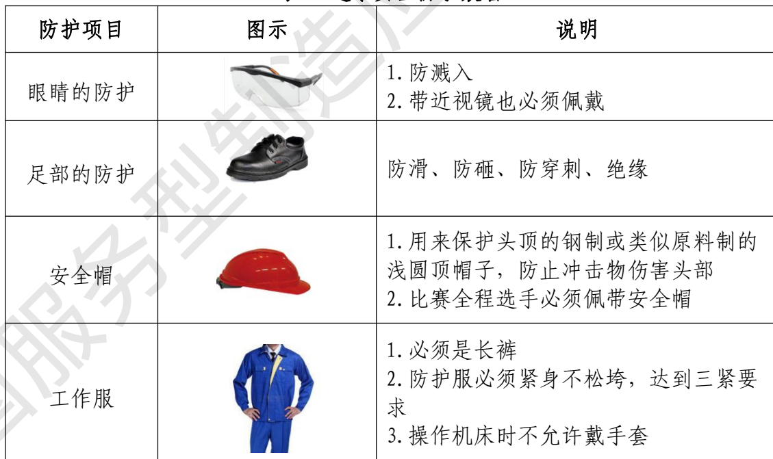
表 3 选手安全防护装备

大赛时，裁判员对违反安全与健康条例、违反操作规程的选手和现象将提出警告并进行纠正。不听警告，不进行纠正的参赛选手会受到不允许进入竞赛现场、罚去安全分、停止加工、取消