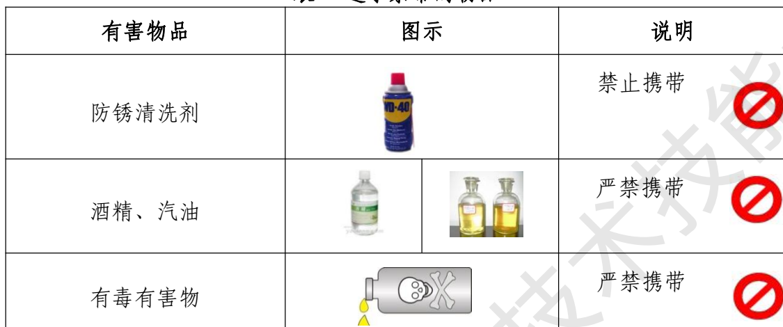
表 4 选手禁带的物品