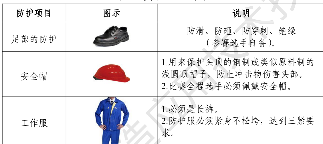
表 5 选手安全防护装备

大赛时，裁判员对违反安全与健康条例、违反操作规程的选手将进行警告并纠正，不服从的参赛选手将受到不允许进入竞赛现场、处罚安全分、停止加工、取消竞赛资格等不同程度的惩罚。选手防护装备佩戴要求见表 6。