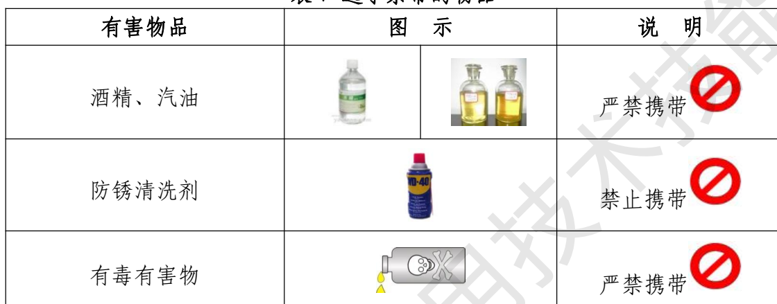
表 7 选手禁带的物品