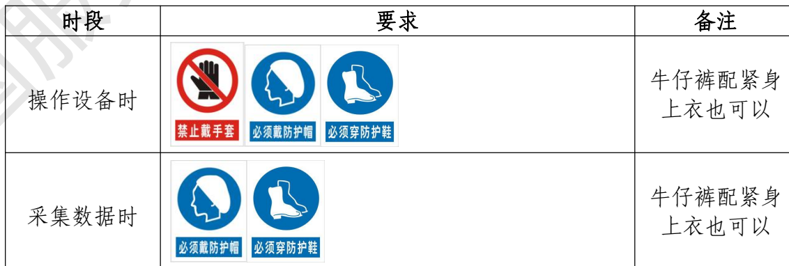
表 6 选手防护装备佩戴要求

大赛时，裁判员对违反安全与健康条例、违反操作规程的选手将进行警告并纠正，不服从的参赛选手将受到不允许进入竞赛现场、处罚安全分、停止加工、取消竞赛资格等不同程度的惩罚。选手防护装备佩戴要求见表 6。