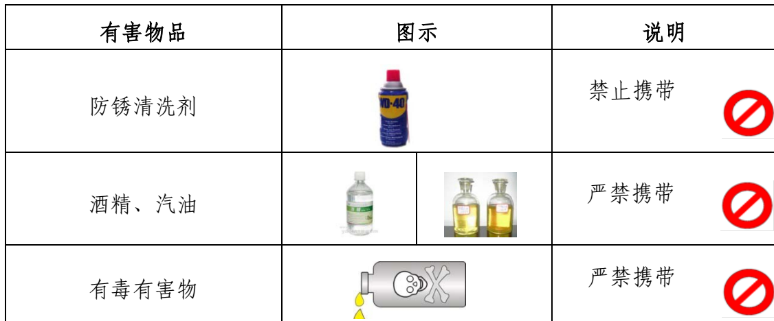
表 7 选手禁带的物品