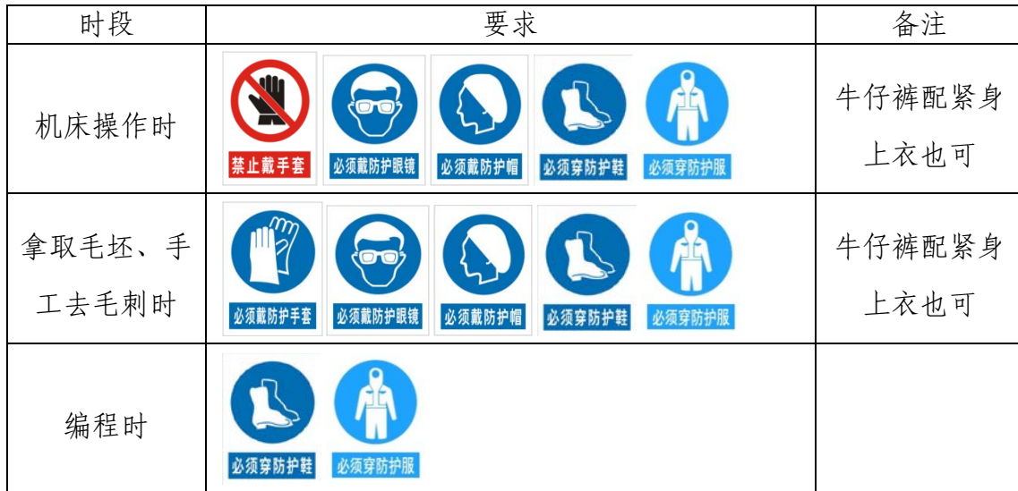
表 6 选手防护装备佩带要求

会受到不允许进入竞赛现场、罚去安全分、停止加工、取消竞赛资格等不同程度的惩罚。选手防护装备佩带要求见表 6。