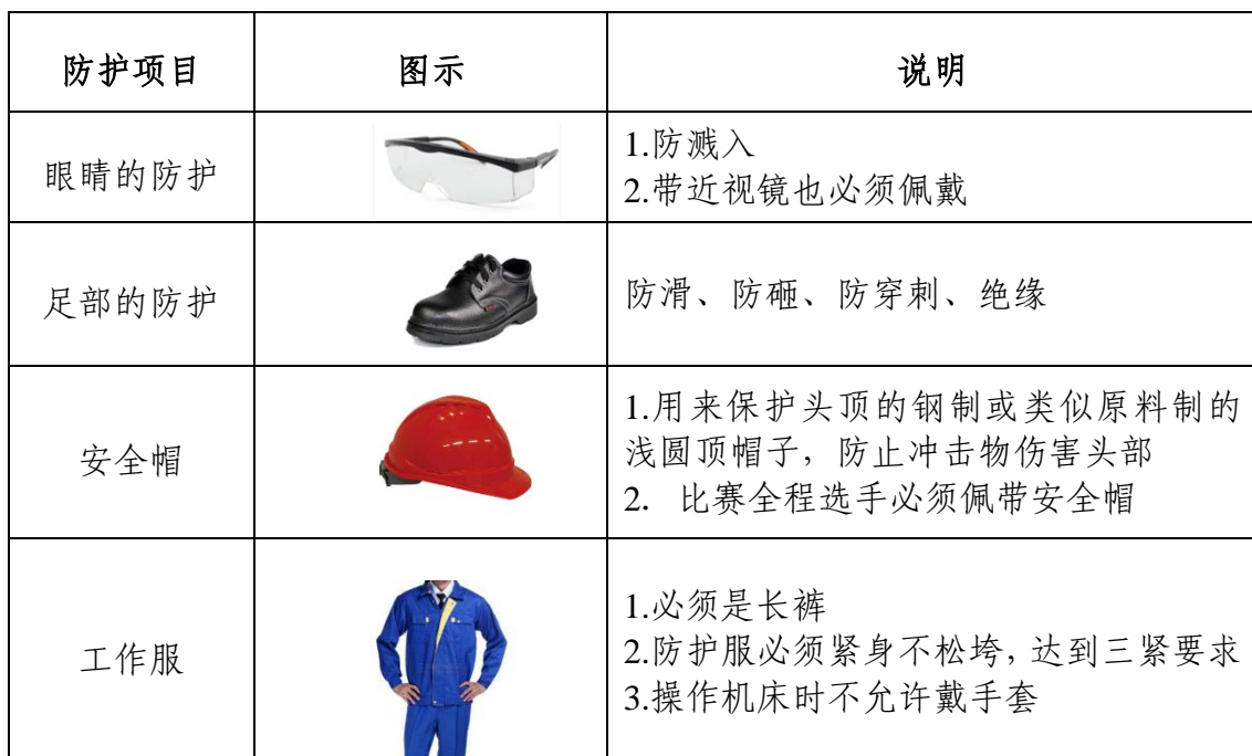
表 5 选手必备的防护装备

大赛时，裁判员对违反安全与健康条例、违反操作规程的选手和现象将提出警告并进行纠正。不听警告，不进行纠正的参赛选手